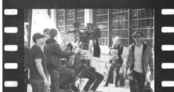
Una de las escenas de la película 'Nothing Against Life'.