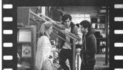
Una de las escenas de la película 'Nothing Against Life'.