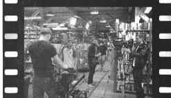
Una de las escenas de la película 'Nothing Against Life'.